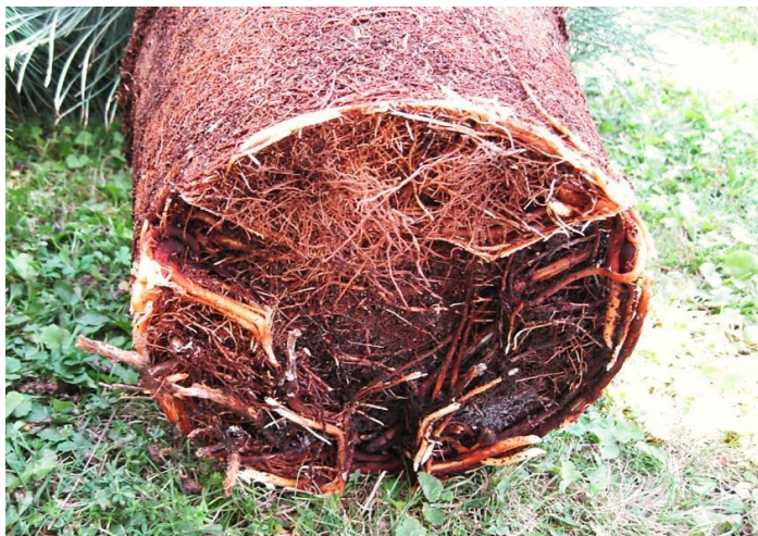
Photo 1 : Déformations racinaires en conteneurs plastiques – AREXHOR G.E. 2012 – photo Miquel

Certains cultivateurs comme Filippi, Clop, Lemonnier (starpot), Caledonian Tree Company (Air pot) ... ont travaillé sur ce problème en développant des pots plastiques permettant de limiter ces défauts.