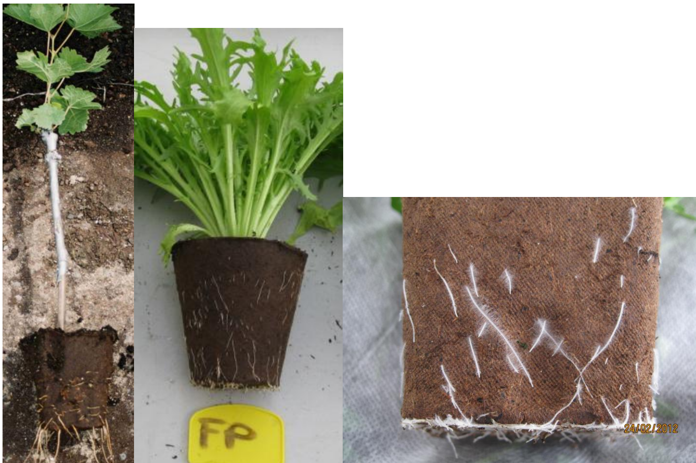
Photos 3: plant de vigne en fertipot, salade en pots biodégradables, détail de racines (pensée)

Sur un plan écologique, le fait d'utiliser un pot à base de fibres végétales locales et renouvelables qui sera restitué à la terre permet de travailler de manière circulaire et d'éviter des déchets à base de matières premières non renouvelables.